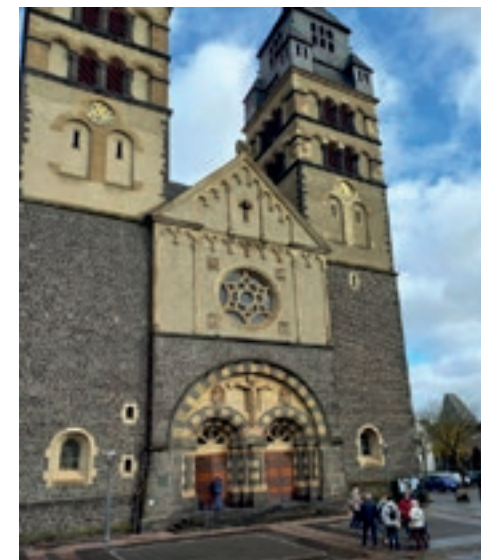
Eines der Wahrzeichen der Stadt Mayen, die Herz-Jesu Kirche.

Ein außergewöhnliches Bauwerk im Zentrum von Mayen fällt ins Auge. Die gedrehte Spitze des Glockenturmes der Pfarrkirche St. Clemens, die wohl weltweit ihres Gleichen sucht.