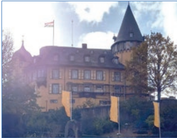
Genovevaburg von Mayen

Unser zweiter Stopp war die Stadt Cochem. Die Reichsburg mit ihrer tausendjährigen Geschichte ist ein Anziehungspunkt im Feriengebiet Cochem. Egal aus welcher Richtung man sich der Stadt nähert, thront die Burg auf einem steilen Bergkegel, der sich über 100 Meter über der Mosel erhebt.