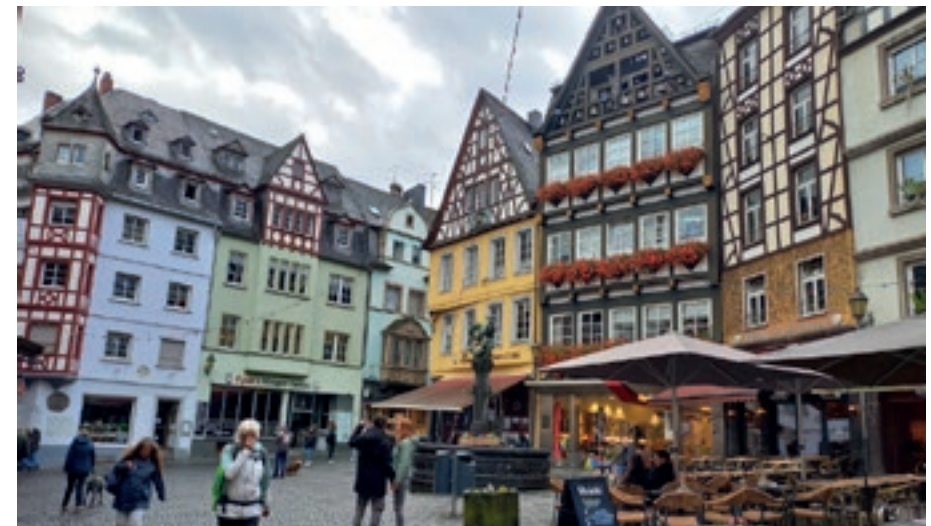
Der Marktplatz mit dem Martinsbrunnen

Als nächstes besuchten wir das Moselland-Museum in Ernst, ein Museum der besonderen Art. Dort im Ort war auch unser Hotel für drei Tage.