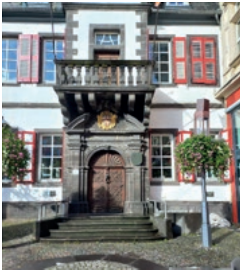
Historisches Rathaus von 1739 in Cochem am Marktplatz.

Der erste Halt an der Stadtmauer von Mayen unterhalb der Genovevaburg : „Mayen, das Tor zur Eifel“! Zu Fuß kamen wir zum Marktplatz. Ein recht großer Platz im Zentrum von Mayen mit schönen Cafés und Geschäften. In den umliegenden Gassen finden sich einige schöne Fachwerkhäuser.